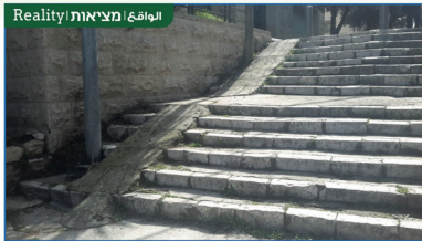
Realitiy | מציאות | الواقع

בונים חזון לעתיד ירושלים: הסכמה מלמטה-למעלה بناء رؤى لمستقبل القدس: نهج من أسفل إلى أعلى