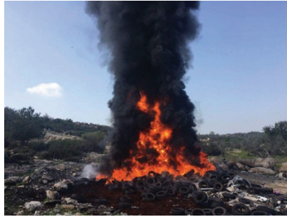
איור 4: שרפת צמיגים בשטח הפתוח בשכונת א-ת'ורי