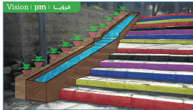
Vision | חזון | الرؤية

Stairs and sidewalk are colorless and lifeless without any congruency with their role as public space המדרגות והסלילה חסרות צבע וחיים ללא כל קשר עם תפקידן כחלק מרחבי הציבור