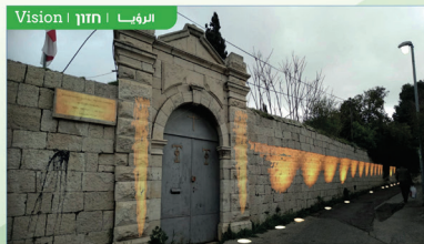
Vision | חזון | الرؤية

History is forgotten and identities are diminished as we walk indifferently next to the Greek Orthodox church wall. ההיסטוריה נשכחת והזהות מלמטה מוטאנה כשאנחנו עוברים בלי חשש הכנסייה הלבנה