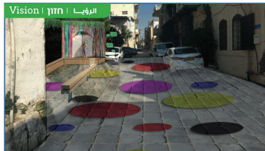
Vision | חזון | الرؤية

This deserted road is the entrance to many residents' homes; the first place they see when they leave and the place where their kids play. דרך נטושה זו היא הכניסה לתווך רבים של התושבים. המקום הראשון שבו רואים אותם כשהם עוזבים את בתיהם. המקום בו ילדיהם מתחמקים