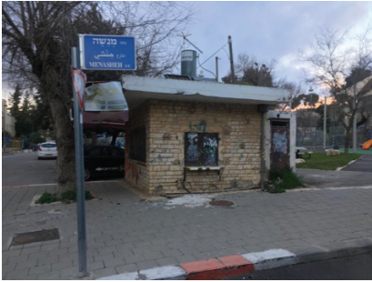
איור 5: קיוסק נטוש בשכונת אבו תור הישראלית

ושטח נטוש ריק על התפר שבין השכונה הישראלית והפלסטינית. הקבוצה המעורבת המקצועית בחרה תמונות של חללים שהתערבויות בקנה מידה קטן עשויות להפוך אותם למושכים ומזמינים יותר, כמו מדרגות רחוב (איור 6). תמונות אלו אינן מייצגות בהכרח את הבעיות ה"בוערות" ביותר מבחינת תשתית, אך הן מציעות הזדמנויות למרחב עירוני נקי, בטוח ומשותף.