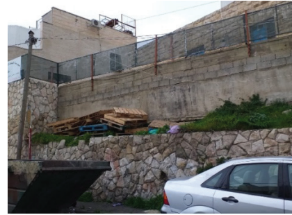
איור 3: קווי חשמל חשופים בשכונת א-ת'ורי

קבוצת הדיון בנושא התשתיות החליטו להתמקד בשטחים פתוחים ציבוריים, שהם רק היבט אחד של נושא התשתיות. בהתאם לכך, תמונות העתיד שלהם לשכונה התמקדו ב-placemaking, התערבויות מקומיות בקנה מידה קטן ביוזמת הקהילה שיכולות לייפות את השטחים הפתוחים בשכונה ולהפוך אותם מסבירי פנים לקבוצות שונות מבחינת גיל, מגדר או מוצא אתני.