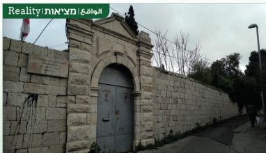
Realitiy | מציאות | الواقع

Transforming the road to a pedestrian road full of colors, shades and cute corners, which is safe for children and elderly alike. הרכיב הבסיס לרפורם ליהנות רחוב מלא בצבעים, גוונים ופינות חמודות, שיהיה בטוח לילדים וקשישים כאחד