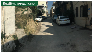
Realitiy | מציאות | الواقع

Stairs can be like a waterfall full of life, color, and inspiration when one goes to work or comes back home. המדרגות הן כמו מפל מים מלא חיים וצבע ומעוררת השראה בדרכי לעבודה או כשנחזור הביתה